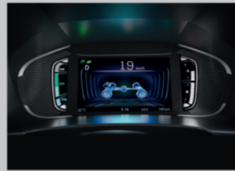
DIGITAL MULTI-INFORMATION DISPLAY